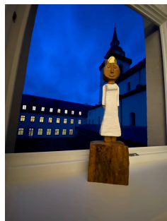
Ralf Knoblauch: Königin der Menschenwürde

Für weitere Stammtische schlagen wir aktuelle Themen vor und freuen uns auf Vorschläge von Ihnen.